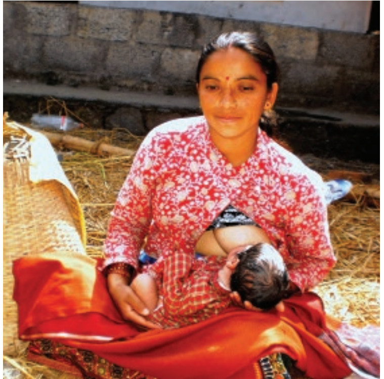
Gokul Pathak © WABA 2013

Los mensajes abogacía deben incluir aspectos ambientales, como frenar el uso excesivo de plaguicidas y fertilizantes. Debe darse prioridad a las alianzas con organizaciones locales que trabajen entre los grupos menos favorecidos y marginados. Por último, el Código Internacional de Comercialización de Sucédáneos de la Leche Materna es un marco, en algunos países legal para regular la industria de alimentos infantiles. Este Código ayuda a proteger tanto el medio ambiente como el derecho a amamantar. Debemos trabajar para asegurarnos que sea implementado y monitoreado efectivamente.