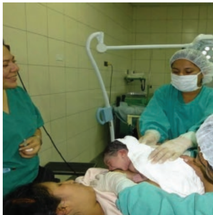
Delly Mishu © WABA 2013

El objetivo acordado por los gobiernos es priorizar la meta global de la Asamblea Mundial de la Salud (AMS), de lograr un aumento en el porcentaje de lactancia materna exclusiva durante los primeros 6 meses de vida de al menos el 50 % para el año 2025. Respaldemos esto juntos para transformar la evidencia en acciones a favor de la lactancia materna.