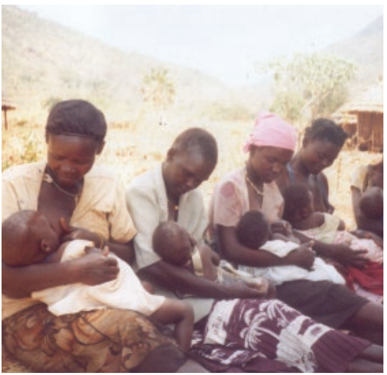
Harold Lubanga-Kiryowa © WABA 2008

A amamentação não é só uma questão feminina ou responsabilidade exclusiva da mulher - a promoção, protecção e apoio à amamentação é uma responsabilidade colectiva da sociedade que precisa ser partilhada com todos nós.